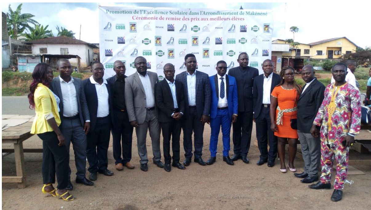
Fig 2 : Les membres de la Dypamak