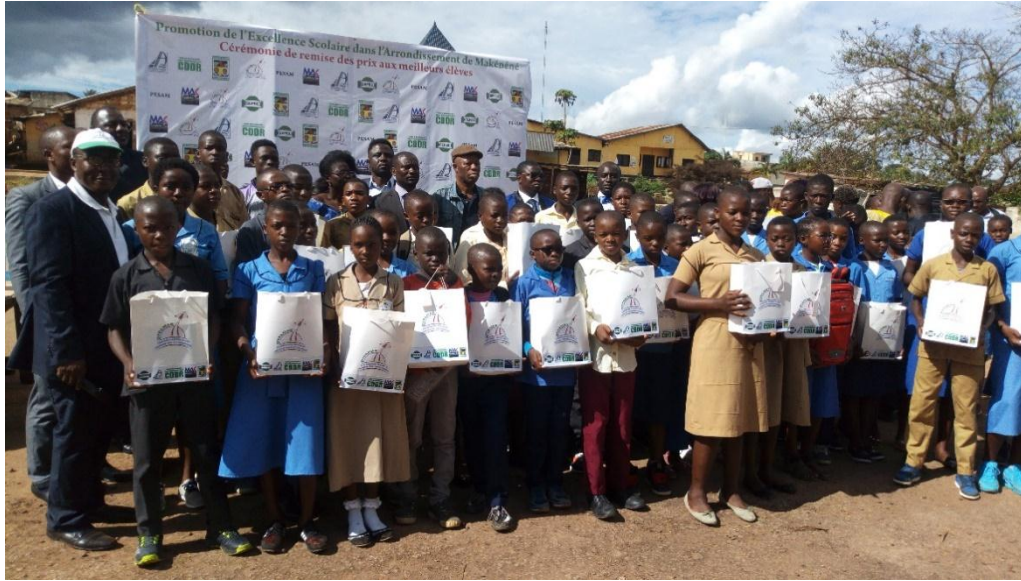
Fig1 : photo de famille