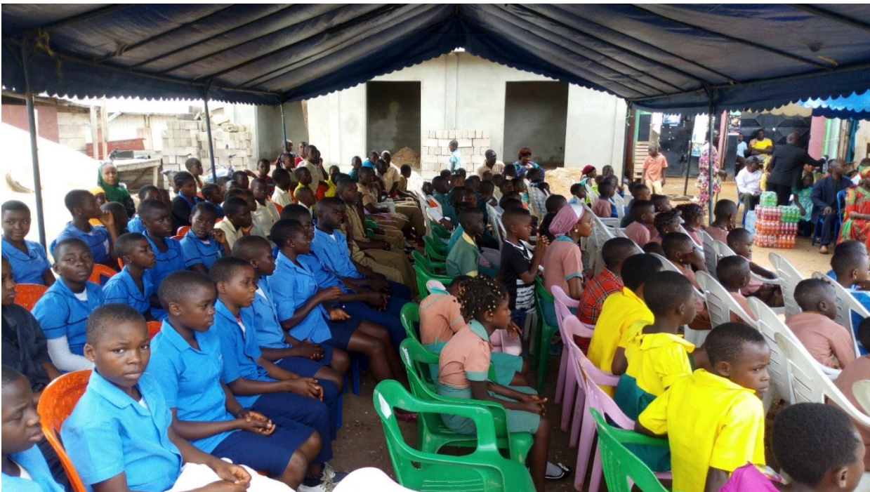
Fig3 : Les lauréats

En plus de ces prix, grâce à l'appui spécial d'une amie de bonne volonté, 03 kits scolaires ont été remis à trois enfants défavorisés.